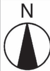
第 2-1-1 図 調査対象地域